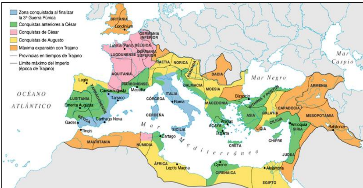
Mapa de las provincias del Imperio Romano

Durante quinientos años el latín fue la lengua hablada en la mayor parte de Europa, que era la zona que controlaba el Imperio Romano y los territorios adyacente que estaban bajo su influencia cultural. Sin embargo, no existió una política de alfabetización ni de educación por parte de los gobernantes. Por esta razón, el latín fue diferenciándose progresivamente en una forma culta, que hablaban las élites dirigentes, y una forma vulgar que hablaba el pueblo.