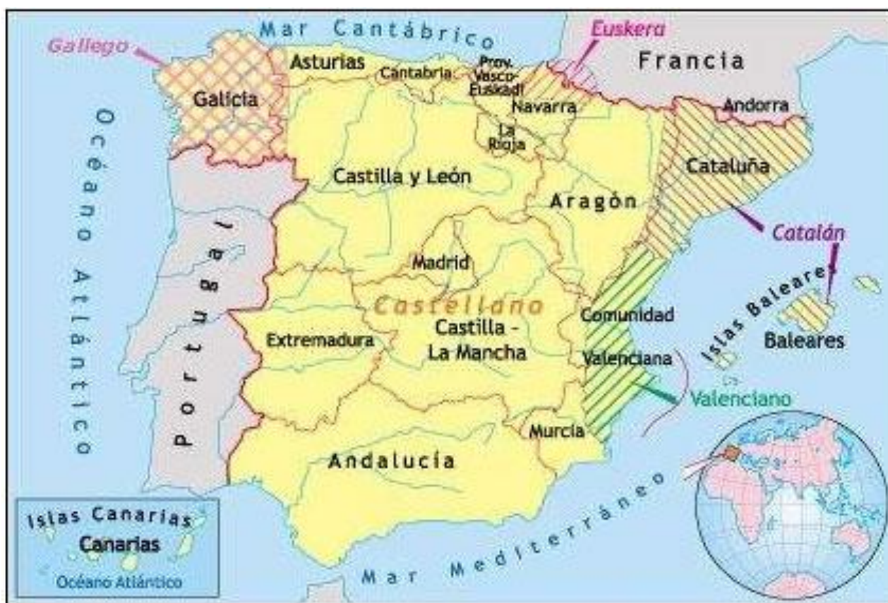
Mapa de las lenguas de España

Actualmente se hablan en Europa alrededor de 26 lenguas derivadas del latín, siendo las más importantes el francés, el italiano, el español, el portugués y el rumano. En la Península Ibérica se formaron tres zonas lingüísticas principales: la gallego-portuguesa en el oeste, la castellano-aragonesa en el centro, y la catalano-valenciana en el este.