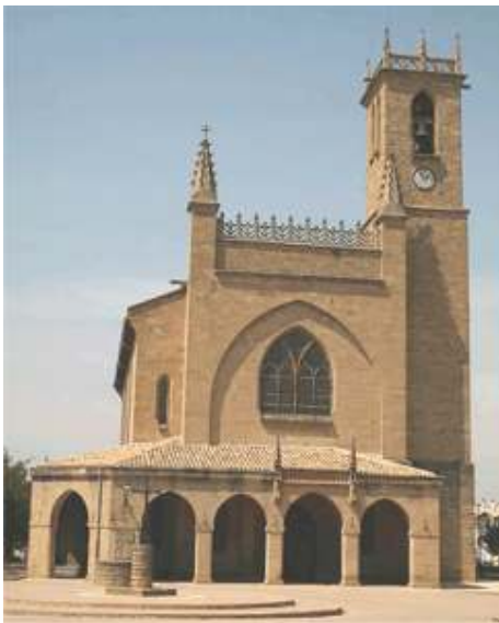
Iglesia puente la reina