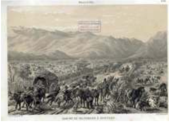
Camino Valparaíso Santiago